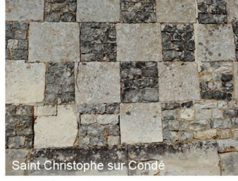
Saint Christophe sur Condé