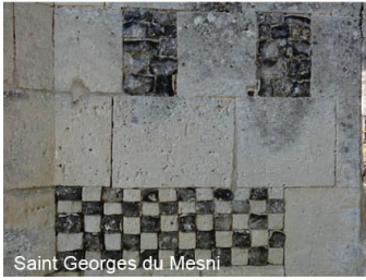
Saint Georges du Mesnil