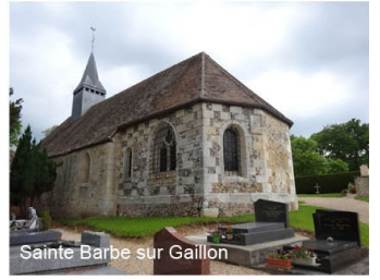
Sainte Barbe sur Gaillon