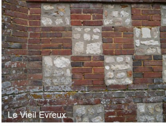
Le Vieil Evreux