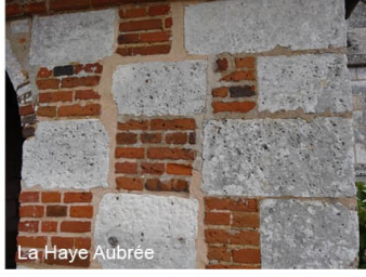
La Haye Aubrée