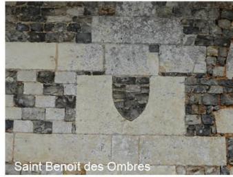
Saint Benoit des Ombres