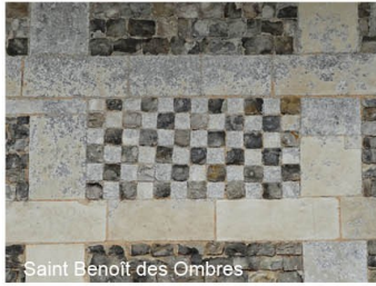
Saint Benoit des Ombres