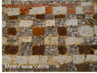
Mesnil sous Vienne