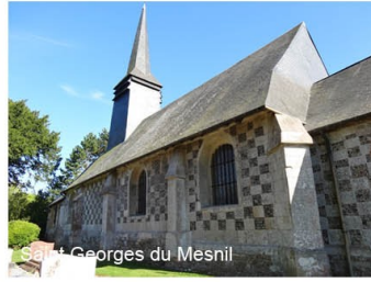
Saint Georges du Mesnil