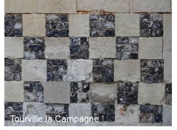
Tourville la Campagne