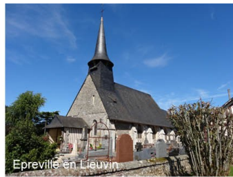
Epreville en Lieuvin