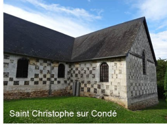
Saint Christophe sur Condé